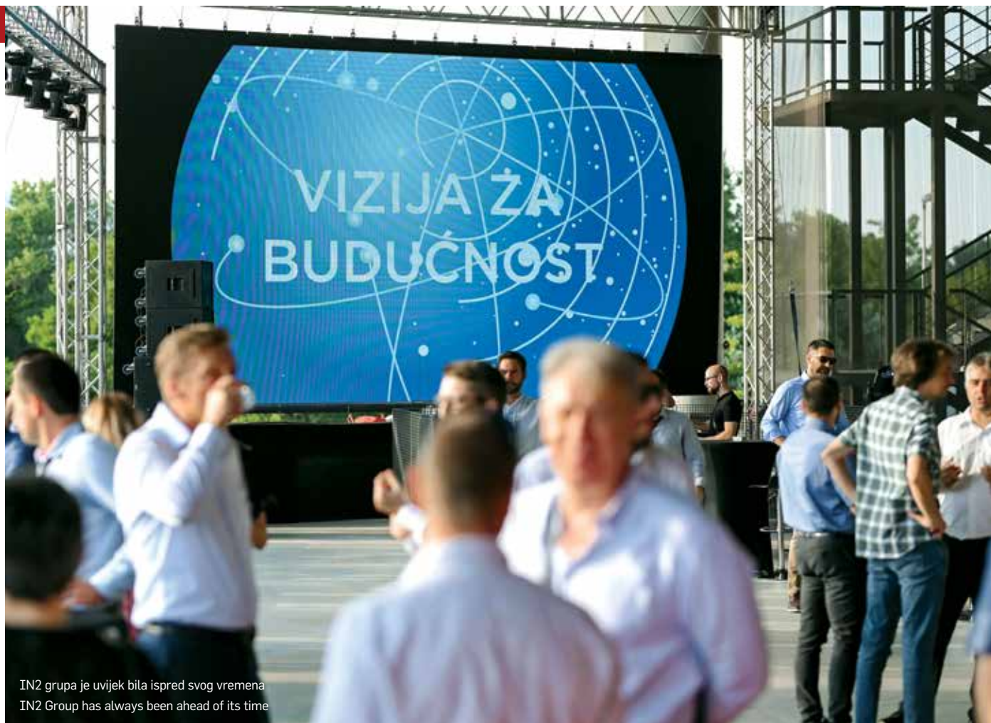
IN2 grupa je uvijek bila ispred svog vremena IN2 Group has always been ahead of its time

ima zahvaljujući stotinama uspješno odrađenih projekata iz područja zdravstva, bankarstva, osiguranja, gospodarstva te javne uprave razlog je zašto se od 2018. godine nalazi u sustavu CSI grupacije, koja okuplja samo najbolje svjetske IT kompanije u svojem portfelju. Upravo to je i jedan od razloga zašto se CSI grupacija, današnji vlasnik IN2 grupe, nalazi u top 10 najvrednijih brendova u globalnoj IT industriji prema ljestvici Brand Finance. Činjenica da je IN2 grupa postala dio tako snažne grupacije svrstava je među najrespektabilnije pružatelje tehnoloških rješenja u Hrvatskoj i regiji. IN2 grupa je unutar CSI grupacije centar izvrsnosti za zdravstvene informacijske sustave u jugoistočnoj Europi te se očekuje da će se buduće europske akvizicije u zdravstvu od 2022. godine događati upravo u sklopu IN2 grupe.